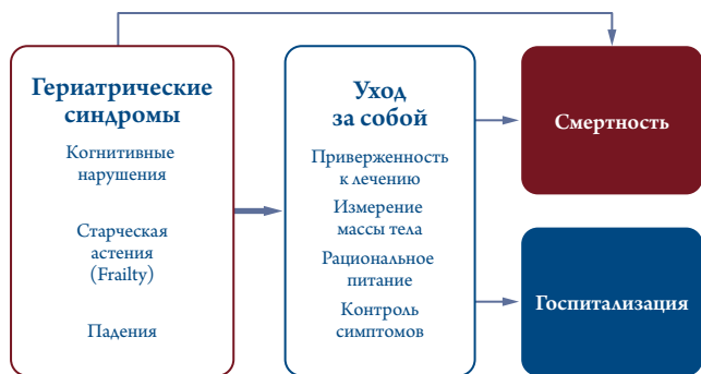
Рис. 3. Взаимосвязь между гериатрическими синдромами и исходами у пожилых больных с хронической сердечной недостаточностью.

Регулярное наблюдение пациента с ХСН способствует большей приверженности к лечению, чем просто обучение пациента [38]. В исследовании A. Gjesing и соавт. [5], в котором приняли участие 8792 пациента (средний возраст 69 лет) с ХСН, была выявлена высокая приверженность к медикаментозной терапии пациентов, наблюдавшихся в специализированных амбулаторных клиниках сердечной недостаточности, которая сохранялась и в дальнейшем при их наблюдении врачом общей практики. За 90 дней до поступления в клиники 87% пациентов получали блокаторы ренин-ангиотензин-альдостероновой системы (РААС). Спустя 90 дней наблюдения 95% больных оставались на терапии препаратами этой группы. Аналогичная ситуация наблюдалась по приему β-адреноблокаторов (72 и 88% больных соответственно) и спиронолактона (30 и 38% соответственно). Спустя год